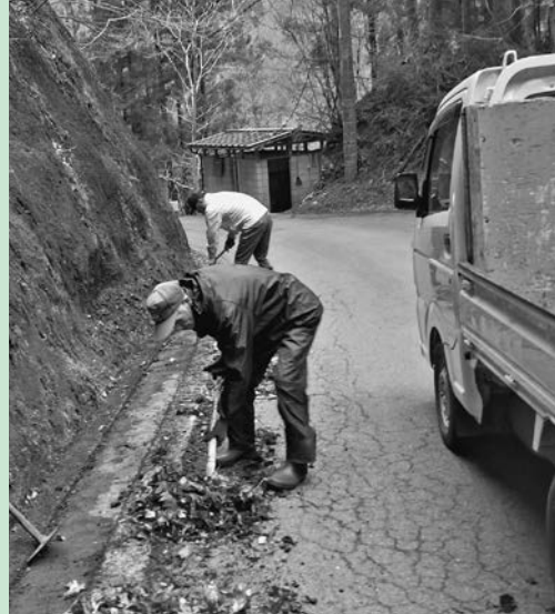
森林管理道清掃作業