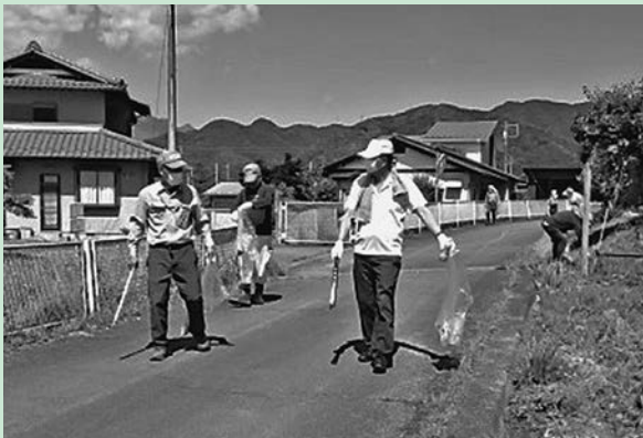
ボランティア活動