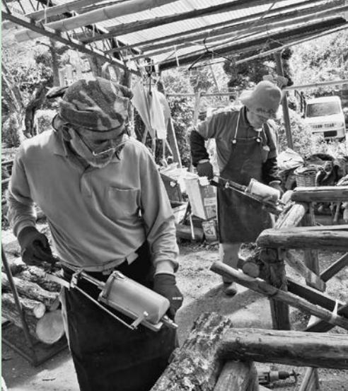
原木椎茸の駒植え作業