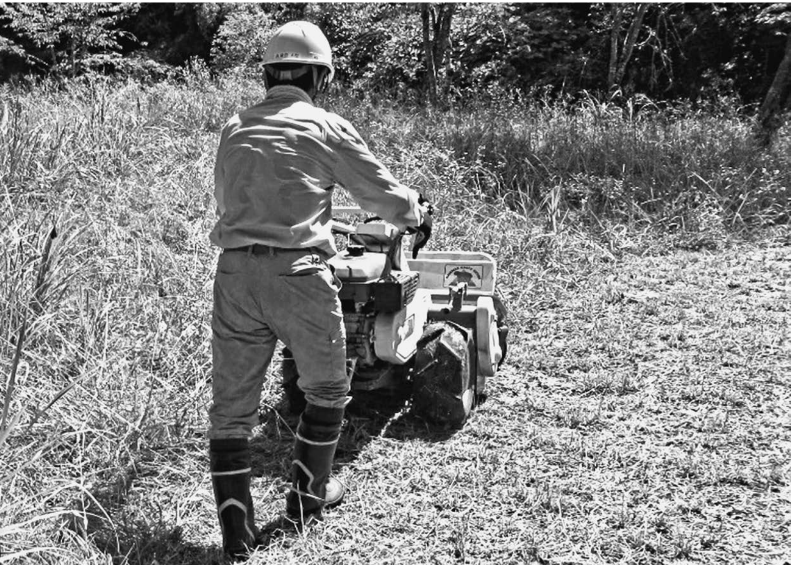
自走式草刈機（ハンマーナイフ）による草刈作業