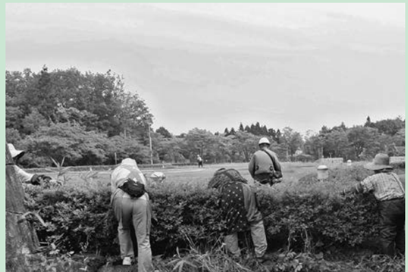
防災基地管理作業